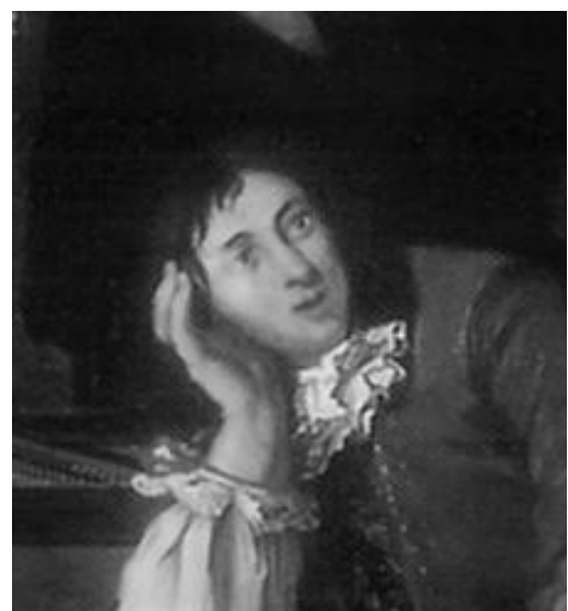
Dieterich Buxtehude Ausschnitt aus „Musizierende Gesellschaft“ von Johannes Voorhout 1674

Lassen wir uns von dieser mehr als 300 Jahre alten Musik, die unserem Denken und unserer Lebensart doch sehr weit entfernt ist, auf ganz besondere Weise berühren.