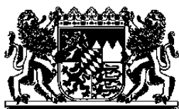
Bayerisches Staatsministerium für Wissenschaft und Kunst